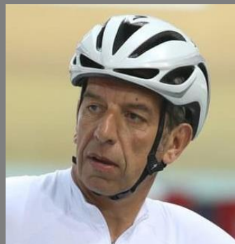
Docteur Michel Cymes

Médecin de renom, un des animateurs de télévision les plus appréciés. « Des études prouvent que l'on peut réduire le risque pour certains cancers (colon, sein) et même réduire considérablement le risque de récurrence chez ceux qui ont déjà eu un cancer ».